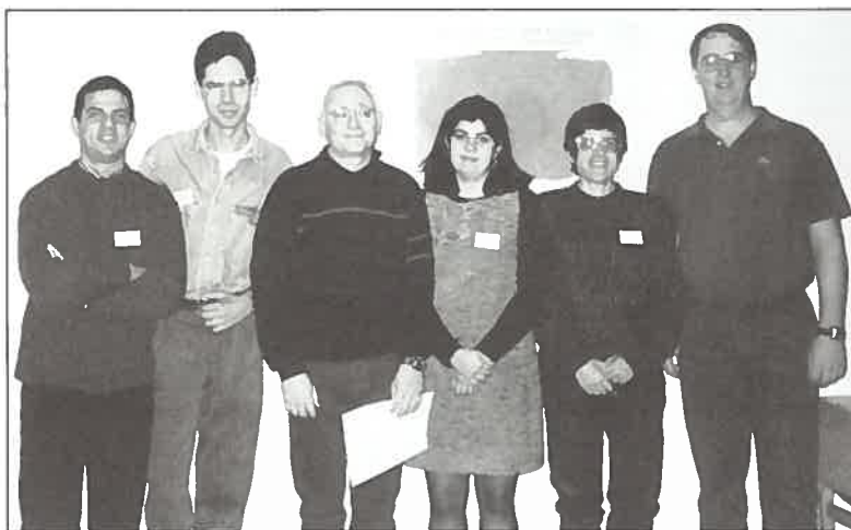
O IH representado na Conferência Europeia HYPACK 98.