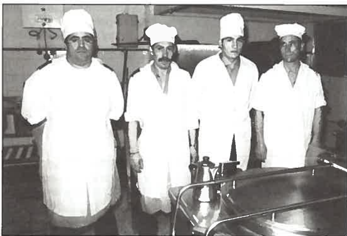
O pessoal da cozinha do IH com as novas fardas

É preocupação da Direcção melhorar as condições que rodeiam todos os funcionários do IH no seu dia a dia de trabalho. Uma das medidas já adoptada foi a instalação da Caixa Multibanco que nos poupará as des-cidas até Santos.