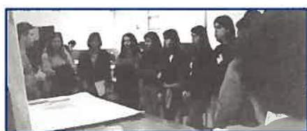
Os alunos da Escola El-Rei D. Manuel I, na sua passagem pela Divisão de Hidrografia

Decorreu no dia 11 de Fevereiro de 1998 uma visita de estudo de 14 alunos do 11º ano da Escola El-Rei D. Manuel I, de Alcochete, acompanhados por 3 professores. Os alunos referiram que têm especial interesse no tema dos Oceanos.