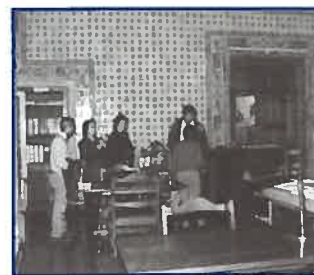
Os técnicos da CM de Lisboa a observarem os azulejos da antiga cozinha do Convento das Trinas

os quais se inclui o antigo Convento das Trinas, para depois ser elaborado um relatório a ser entregue no IPPAR - Instituto Português do Património Arquitectónico e Arqueológico. Os locais visitados foram o Auditório (antigo coro alto da igreja), o jardim e a Biblioteca (antiga cozinha). Resta-nos aguardar novidades sobre o desenrolar de uma eventual alteração na classificação do edifício onde se encontra instalado o Instituto Hidrográfico.