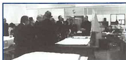
O chefe da Divisão de Hidrografia a apresentar aos Auditores do Curso Superior Naval de Guerra alguns trabalhos executados