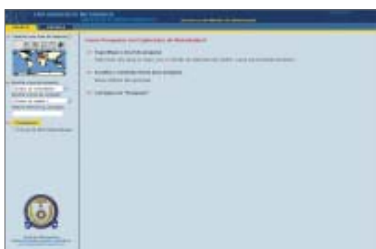
Página inicial do Explorador de Metadados

Neste sentido, o Centro de Dados do IH tem vindo a utilizar esta norma técnica na produção de fichas de metadados, no âmbito do processo de implementação do explorador de metadados que se encontra em curso.