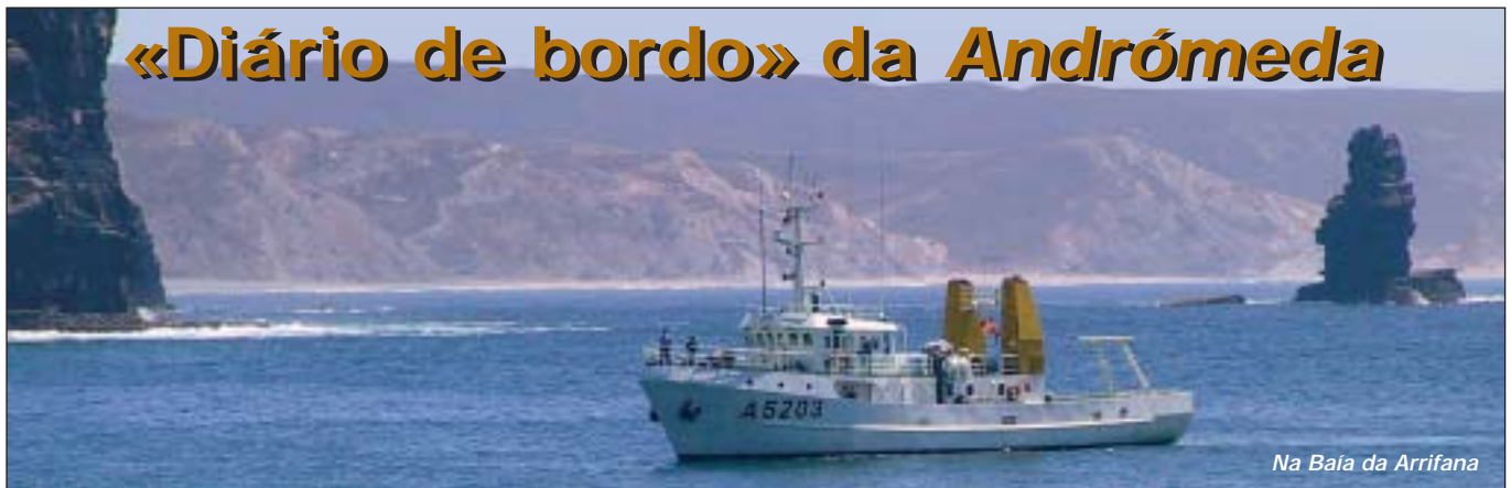
Na Baía da Arrifana

Prosseguindo a colaboração com a Divisão de Navegação do IH, no âmbito do projecto do novo Roteiro da Costa de Portugal, o NRP Andrómeda deslocou-se para os mares do Algarve de 4 a 9 de Junho.