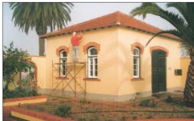
Beneficiação da Casa das Bóias

A trave mestra principal, em avançado estado de degradação, foi substituída por outra igualmente em madeira, dado que esta Secção requer a utilização de material não magnetizável na estrutura, para que não haja interferência no processo de calibração das bóias. Foi ainda feito um tratamento químico de todas as madeiras aí existentes, para expurgo de parasitas. A Casa das Bóias recebeu também uma beneficiação total dos seus espaços interiores e exteriores, incluindo janelas e porta de entrada.