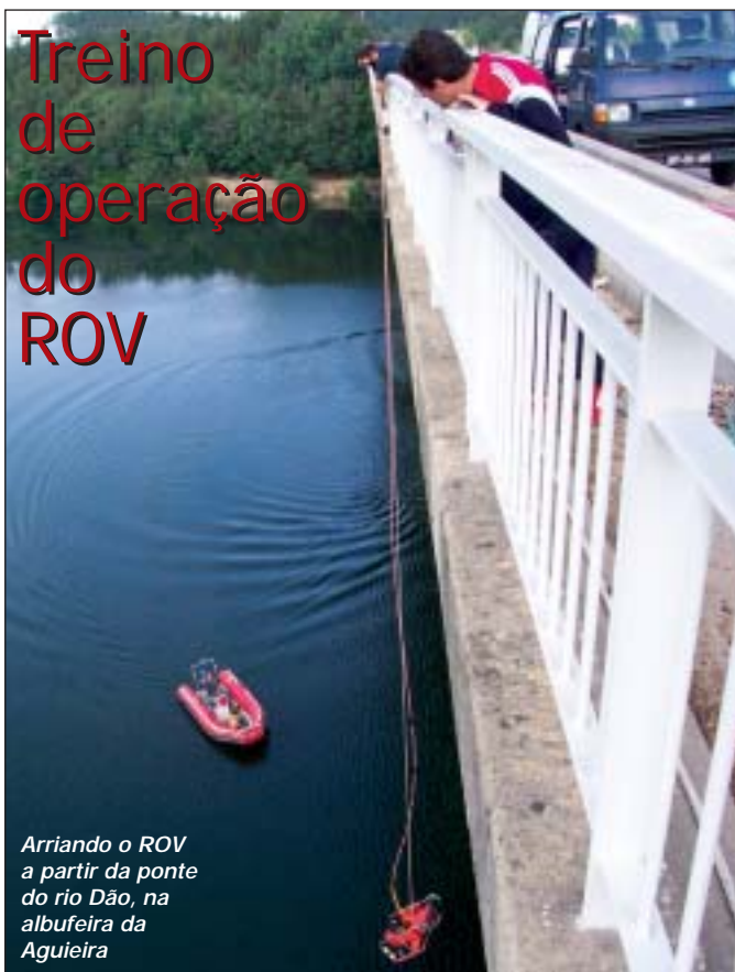
Arriando o ROV a partir da ponte do rio Dão, na albufeira da Aguieira

Quando são operados remotamente, os aparelhos concebidos para realizar trabalhos dentro de água são conhecidos pela sigla ROV, acrónimo de Remotely Operated Vehicle. São sistemas compostos por um veículo submarino, cabo de ligação e consolas de comando e monitorização.