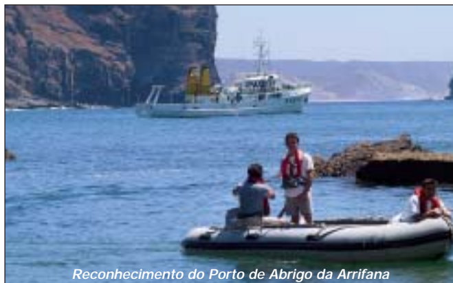
Reconhecimento do Porto de Abrigo da Arrifana

hospital. A norte, Albarquel e a cidade sadina. Deixando a bóia do João Farto por BB, seguimos rumo à Lisnave, observando-se chaminés e guas características desta zona industrial, na margem nascente do rio. Na península de Tróia os prédios da Torraltta e mais a sul o PAN Tróia. Passando a bóia 14 entramos na bacia de manobra do estaleiro e, após algumas fotos de pormenor, regressamos para norte. Fazendo uma passagem pelas docas e cais junto à cidade de Setúbal, apanhamos o enfiamento e saímos a barra.