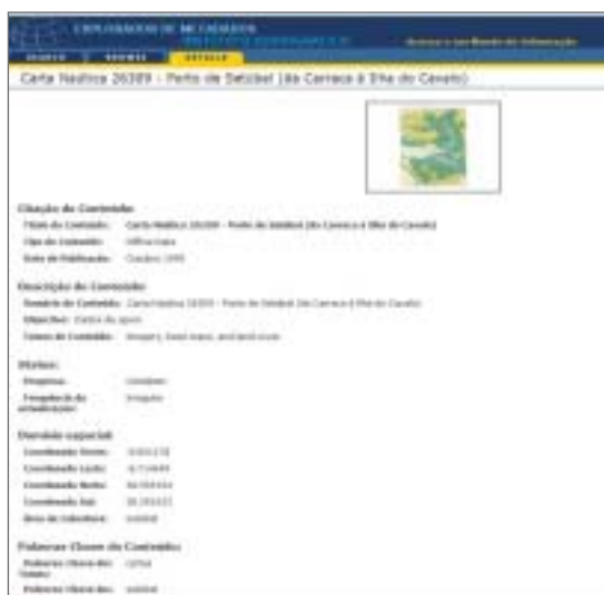
Exemplo de um resultado de pesquisa a uma ficha de metadados