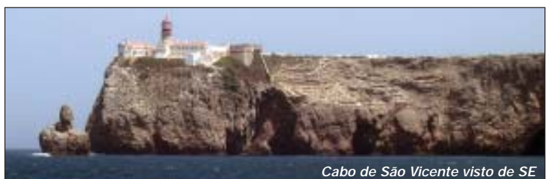
Cabo de São Vicente visto de SE

Regressando ao longo da costa, Quarteira com os seus conspícuos prédios e o novo porto de pesca. Logo a seguir, no meio de uma enorme mancha verde, os fabulosos aldeamentos de Vale de Lobo e Quinta do Lago, vislumbrando-se algumas «pequenas» casas, ótimas para passar um fim-de-semana de merecido descanso. Já é visível Faro e junto à costa as ilhas de Faro