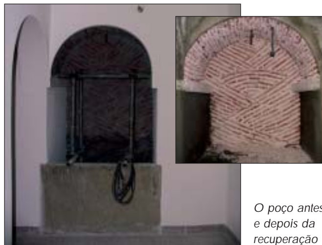
O poço antes e depois da recuperação

de Artes Gráficas. Esta obra, atenta a sua especificidade e, em particular, o elevado índice de salitre existente nas paredes originais do Convento, obrigou a que se tivesse que proceder a uma picagem de todo o reboco até à face das pedras e ao seu subsequente tratamento anti-salitre. Foram ainda substituídos os coletores de esgotos, já que os primitivos, em grés, apresentavam estrangulamentos que conduziam ao entupimento das descargas das instalações sanitárias da empena oeste do edifício, e foi substituído o pavimento do referido corredor. Recuperou-se também a zona do antigo poço do Convento, cuja história será proporcionada aos visitantes que por ali passem.