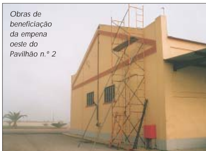
Obras de beneficiação da empena oeste do Pavilhão n.º 2

a entrada de água para o interior dos espaços de trabalho. Foram substituídas as telas de alumínio, beneficiadas as empenas exteriores, e as paredes interiores.