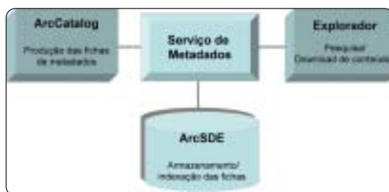
Esquema da cadeia de produção de ficha de metadados desde a sua criação até à sua disponibilização